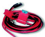
HKN4137 Cable de alimentación de batería de vehículo a radio móvil 3m, 15Amp