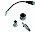
HKN9557 Adaptador para antena mini U/PL259; cable de 2,5 m

PMAE4031 GPS/UHF 450-470 MHz, 1/4 de onda