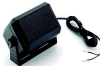
RSN4003 Altavoz externo de 7.5W