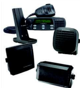
HSN8145 Altavoz externo de 7,5W