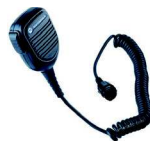
RMN5052 1 Micrófono compacto de mano estándar