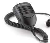
RMN5053 1 Micrófono de mano IMPRES