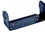
RLN6467 Kit de soporte giratorio de alto perfil