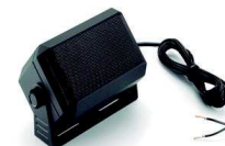
RSN4002A Altavoz externo de 13W