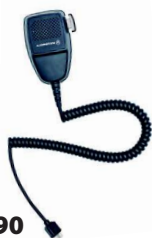
PMMN4090 Micrófono compacto con cable 2m (7')