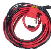
HKN4192 Cable de alimentación de batería de vehículo a radio móvil 6m, 12V