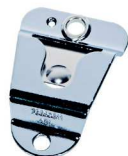
HLN9073 Clip para colgar micrófono (requiere instalación)