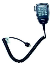
PMMN4089 Micrófono con teclado